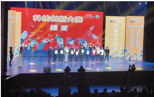
2016 宁波市嘉年华创新赛颁奖典礼