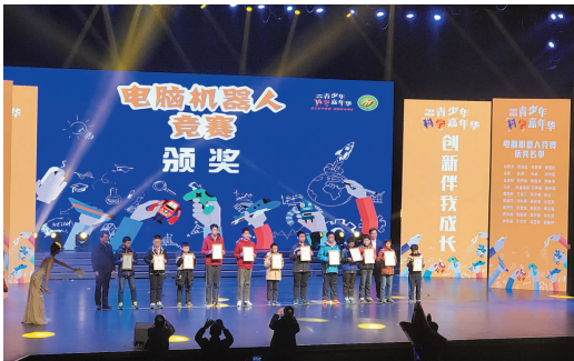
2016 宁波市嘉年华机器人竞赛颁奖典礼