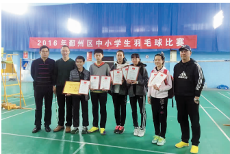
羽毛球荣获区初中团体第一名