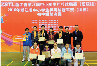
乒乓球队取得省冠亚军