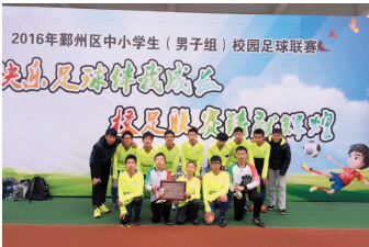
足球队取得区亚军